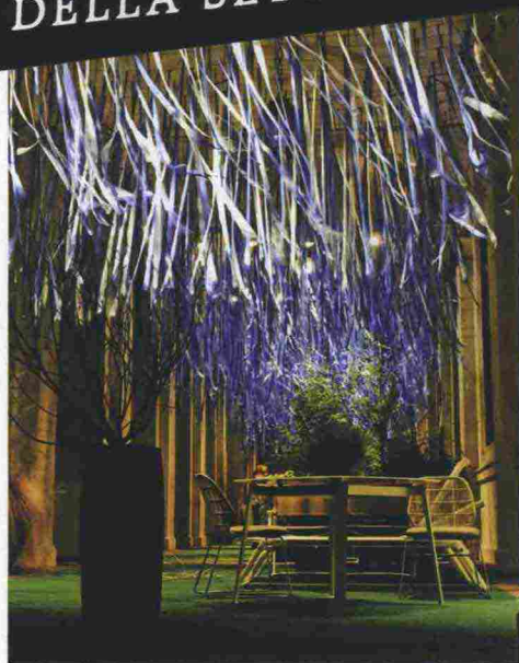
La performance di Roman Signer al festival Transart. A sinistra, l'allestimento Green Design di Zenucchi al festival I maestri del paesaggio.