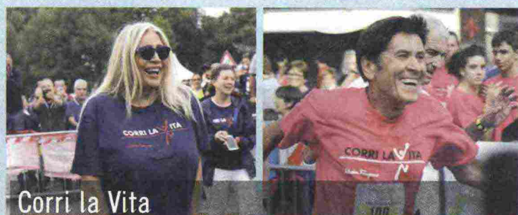
Corri la Vita

INVIARE VIA MAIL I TUOI DATI A info@firenzespettacolo.it (c'è del buono a Firenze!)