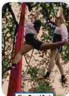
Slow Travel Fest