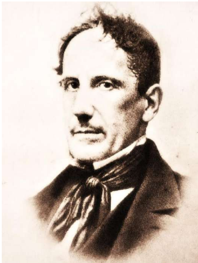
Belli nella maturità

1 L'avidità. 2 Che, quanto più ammucchia tesori e s'ingrassa, tanto più, ecc. 3 Ciechi. 4 Pèrdici. 5 Il sonno. 6 Col falcone. 7 Tutti i progetti, i disegni, ecc. 8 Nascosta. 9 Nessuno può dire. 10 Battere. 11 Nell'intraprendere.