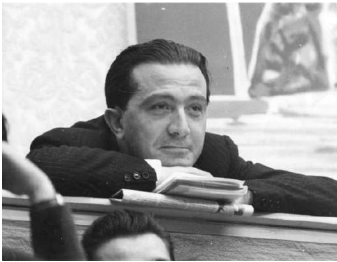
Il giovane Andreotti mezzo censore e mezzo no.

Ambigue e sorprendenti, se non contraddittorie, sono infatti la vita e la storia, ma a Roma ancora di più. "A Papa Grigorio je volevo bene – così suona l'epitaffio per il Papa più bersagliato nei sonetti – perché me dava er gusto de potenne dì male", una specie di onore delle armi. Inutile dire che Belli si accanisce sul Papa del tutto libero da preoccupazioni di ordine religioso, anzi alzando il livello polemico proprio in considerazione della sua configurazione teologica.