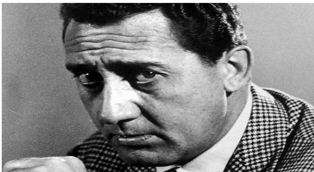
Diffidenza di Sordi.

A uguali magagne, come si vede, corrisponde un medesimo codice per raccontarle, deformarle, addomesticarle a suon di amaro e sapiente scetticismo. Lo ritrovi dolorante e surreale nelle antiche e moderne scritte sui muri: ai tempi dell'occupazione americana: "Annatevene via tutti, lassatece piagne da soli"; ai tempi del terrorismo: "Cossiga come Kabir Bedi, te puzzano li piedi". Rivive negli striscioni alle manifestazioni pacifiste: "State carmi"; ma anche nei vari cicli di intercettazioni telefoniche ("Fa' i froci cor culo dell'altri"), nelle risposte social alle minacce dell'Isis ("Attenti ar raccordo, che restate imbottijati!", come pure "Pijateve pure mi'socera!").