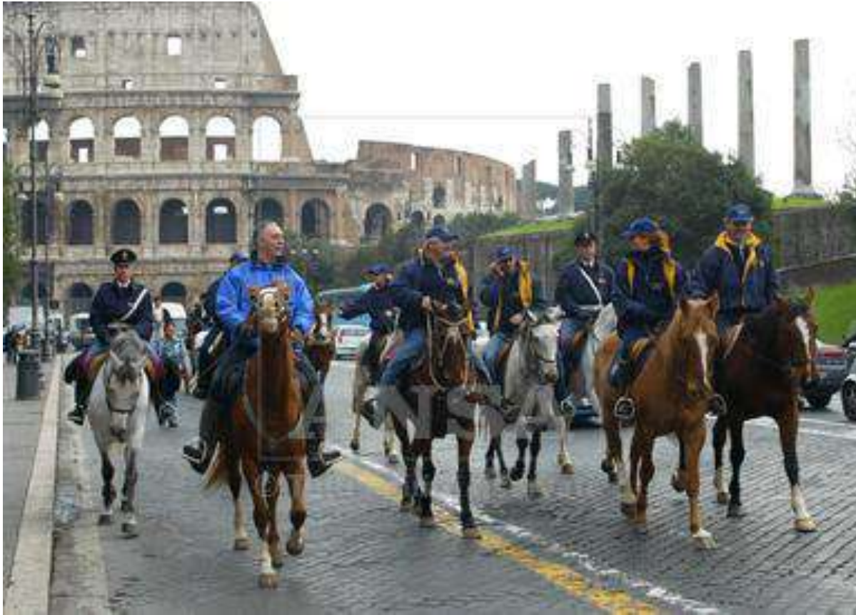
Gli onorevoli cavajeri, dicembre 2003.