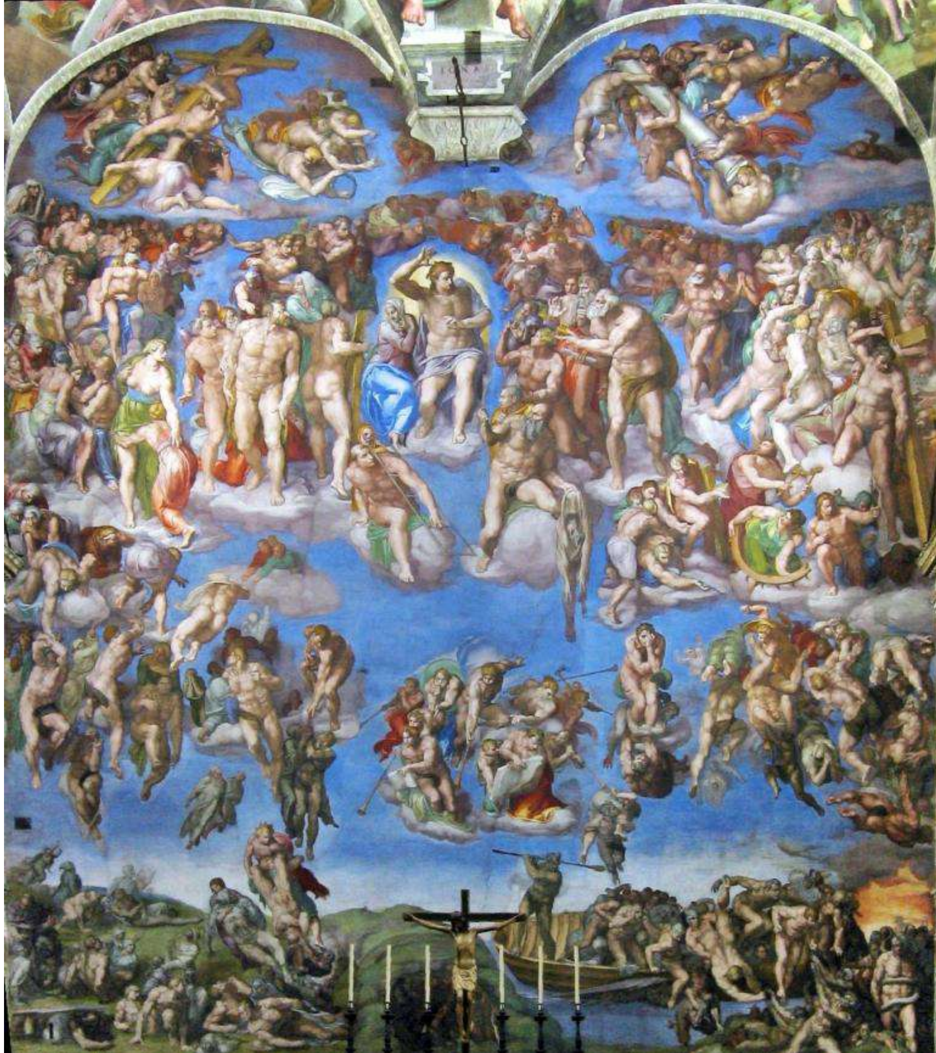
Er giorno del giudizio

Se continuiamo a tenere vivo questo spazio è grazie a te. Anche un solo euro per noi significa molto. Torna presto a leggerci e SOSTIENI DOPPIOZERO (/SOSTIENI-DOPPIOZERO)