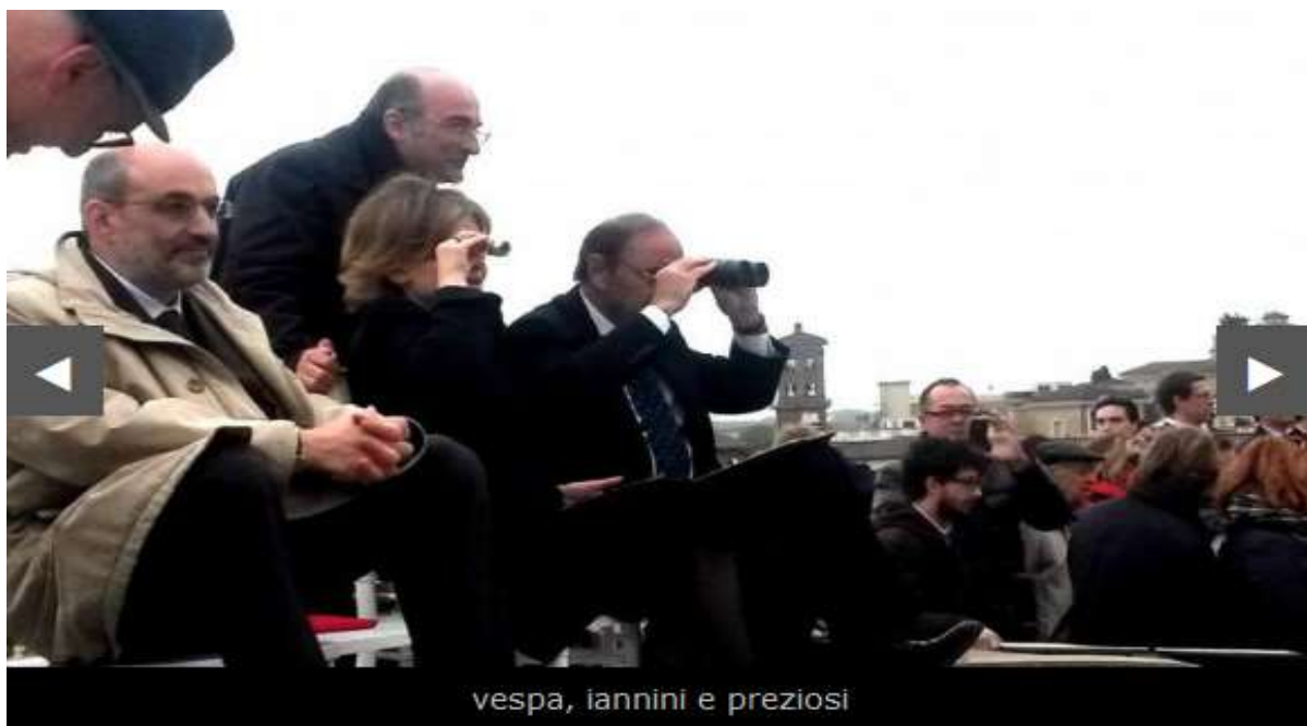
Vespa e altri vip sul tetto della Prefettura apostolica.