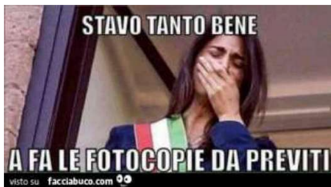
Meme su Virginia Raggi.

Là dove però, nel permanente sfoggio di ruberie e scontrini, improvvidi circenses e magnifiche parate religiose ("Che gran belle funzioni a 'sto paese!") il problema non è tanto dimostrare una lunga catena arrugginita che collega i reggitori ecclesiastici all'amministrazione di Virginia Raggi, quanto le reazioni che nel corso di due secoli almeno tale malgoverno suscita nell'Urbe. E allora vengono in mente i vistosi e peculiari mali che a Roma si ripropongono secondo il più buffonesco aggiornamento: tante di quelle buche da generare proteste persino durante il passaggio del Giro d'Italia, le consuete marmellate di lamiere negli ingorghi, ma da un po' anche voragini che inghiottono automobili e motorette e panchine, i pini mal potati che ogni tanto si schiantano, i "flambus" che prendono fuoco, la cacca degli storni che crea irriconoscibili sculture e rischiosissimi scivolamenti, la piaga fetida della monnezza con i continui avvistamenti di cinghiali tra i semafori e i cassonetti, e in mezzo a tutto questo l'assoluta necessità di uno o forse addirittura due stadi per il calcio, con le già previste vicissitudini giudiziarie che regolarmente accompagnano questi progetti, peraltro nemmeno iniziati, per anni e anni nella capitale. Donde la sconsolata considerazione della sindaca cinque stelle, rappresentata in lacrime in un meme: "Stavo mejo a fa' e fotocopie da Previti!" – ed eccolo, lo spiritaccio romano.