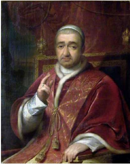
Papa Gregorio XVI

Per cui appena cominciato a fare il giornalista, a Panorama poi alla Stampa e infine a Repubblica , ho sempre fatto in modo che nell'armadietto dietro la scrivania ci fosse a portata di mano l'edizione dei Sonetti, completa di indice dei nomi, dei luoghi e delle cose notevoli; così come nei miei vari pc e devices, compreso l'iphone, non mancano mai files, in formato word e pdf, dedicati per un'agevole ricerca automatica – che in realtà tanto agevole non è considerata le varianti, i raddoppi, le maiuscole – su e giù lungo l'ottovolante dei 2273 sonetti. Amen.