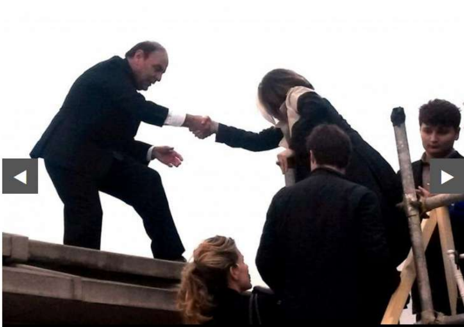
Li rampichini del Palazzo Apostolico, aprile 2014.