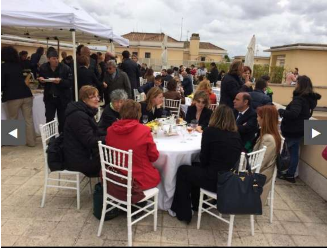
Banchetto per la beatificazione dei due papi.

E ancora, non è questione di demagogia anti-politica, però anche al giorno d'oggi i politici cedono al gusto della patacca e alla smania di far bella figura; così nel dicembre del 2003 accadde che un nutrito drappello di deputati e senatori pretesero e ottennero di attraversare il già caotico centro di Roma a cavallo, mentre altri onorevoli non cavallerizzi li seguivano in carrozza, insieme a vigili, poliziotti e spazzini comunali incaricati di seguire il corteo per raccogliere in tempo reale la cacca degli animali.