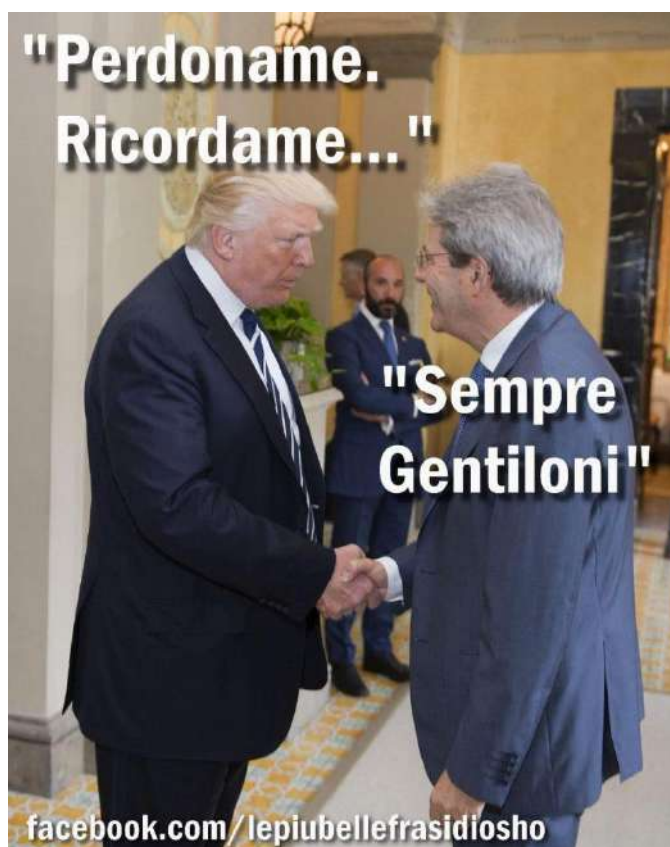
Altro meme di Osho su Gentiloni e Trump.

A uguali magagne, come si vede, corrisponde un medesimo codice per raccontarle, deformarle, addomesticarle a suon di amaro e sapiente scetticismo. Lo ritrovi dolorante e surreale nelle antiche e moderne scritte sui muri: ai tempi dell'occupazione americana: "Annatevene via tutti, lassatece piagne da soli"; ai tempi del terrorismo: "Cossiga come Kabir Bedi, te puzzano li piedi". Rivive negli striscioni alle manifestazioni pacifiste: "State carmi"; ma anche nei vari cicli di intercettazioni telefoniche ("Fa' i froci cor culo dell'altri"), nelle risposte social alle minacce dell'Isis ("Attenti ar raccordo, che restate imbottijati!", come pure "Pijateve pure mi'socera!").