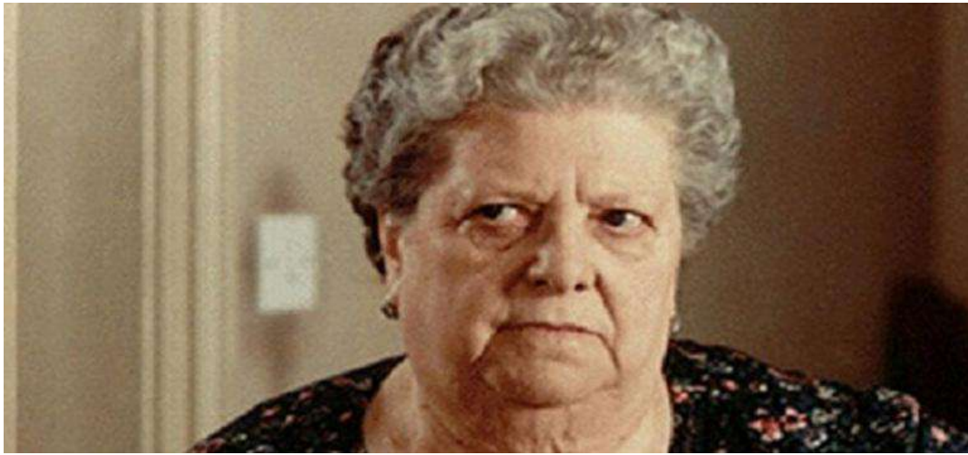
Sora Lella sardonica.

bbene!”), certi implausibili ruggiti di Gigi Proietti, certi sdegnati scatti della Magnani, certi salti logici di Verdone, certe fiabesche tiriterie di Corrado Guzzanti, certe risolte sentenze di Roberto D'Agostino, certe accorati scoppi di risa di Sabrina Ferilli.