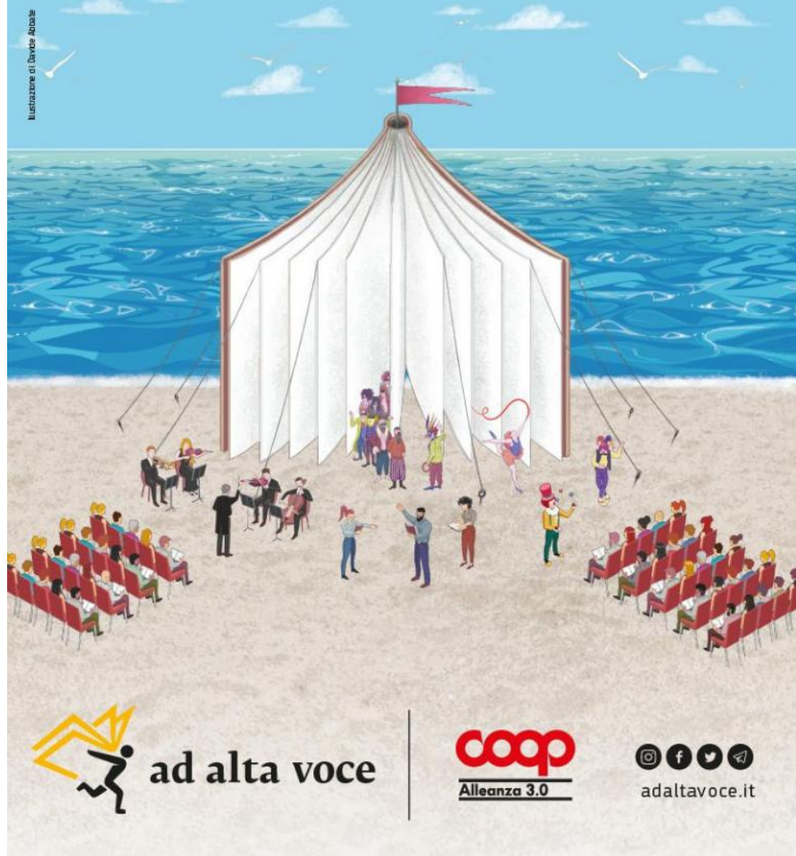
Illustrazione di Davide Albare