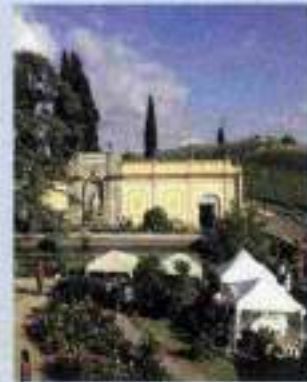
ARTIGIANI A VILLA DEL CIGLIANO San Casciano - ore 10.30-19.30

TUTTE LE FIERE, SAGRE, MERCATI E MERCATINI DEL WEEKEND da pag. 42 a pag. 62