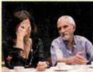
Avamposti TeatroFestival/Anfiteatro Villa Strozzi - Nessuno il maestro di Firenze con e regia E. Nociolini

SUNDAY BRUNCH NEI MIGLIORI LOCALE ns. guida da pag. 133 Orchestra da Camera a S. Stefano al Ponte - G. Lanzetta, Direttore - G. Andaloro, pianoforte Cirk Fantastik/Parco Cascine - ore 17,30 Namrossi Nam Rossa Show - ore 21 Circo El Grilo Uomo Calanthe Villa Vittoria - Aperti-Sunday. Il Cavaliere del Castello di Gabbiano - Serata BBQ Festa dell'ova a Vagliagli, Castelnuovo Berardenga Summer Knight/Piazza del Cavalieri Pisa - Carera