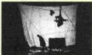
Cirk Fantastik/Parco Cascine - Teatro nelle Foglie Ballata d'Autunno - ore 20.30