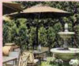
Hôtels Le Jardin/Hotel Regency - Tanghi Champagne aperitivo con Champagne e delizie del mare in collab. con A. Bergère

Mercoledì Musicali all'Auditorium ECRP - D. Both, organo Estate a San Salvi - Colosso viaggio nel Teatro Teatro del Lemming Belmond Villa San Michele - Coccochi e Coccochi specialità locali - dalle ore 18 Empireo Plaza Lucchesi Hotel - Check2Check Villa Corsi - Piazza di Champagne a bordo piscina con musica live - ore 20-22 Settembre Prato - Camera Strumentale Città di Prato Esce nel Cinema Martin Eden di P. Marcello