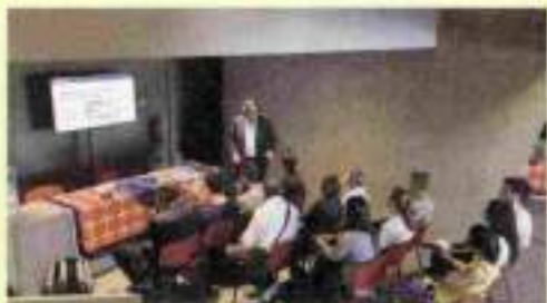
BRIGHT 2019 LA NOTTE DEI RICERCATORI - varie sedi - fino a sab 28

Irene Bistrò/Hotel Savoy - Aperitivo Flah & Spritz - ore 18.30-20.30