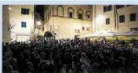
SETTEMBRE IN PIAZZA DELLA PASSERA - The Message - ore 21.30