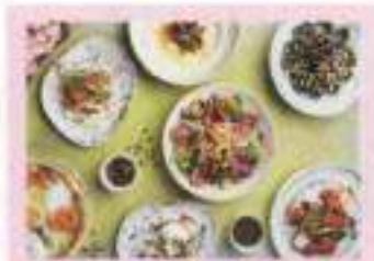
Obicà - I Profumi della Sicilia corsa seminariale - ore 20,30

Villa Vittoria - Shake me Up Sexy Disco Excelsior - Shyanra