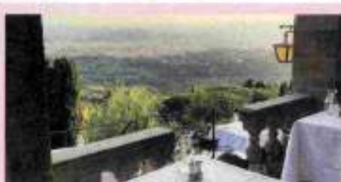
Belmond Villa San Michele - Sunset Picnic - dalle 17

SETTEMBRE IN PIAZZA DELLA PASSERA - Rhythm in Paradise - ore 21.30 Firenze Jazz - Piazza del Carmine e altri luoghi - fino a dom 15 Estate a San Sabini - Maria Stuarda Comp. del Teatro Tor Bella Monaca Empireo Plaza Lucchesi Hotel - Check2Check Picnic - aperitivo Dandy's Night - ore 19-21 Relais La Jardin/Hotel Regency - Torignol Champagne aperitivo con Champagne e delizie del mare in collab. con A. Bergère Villa Cora - Pizza di Champagne a bordo piscina con musica live - ore 20-22 Festa del cinema di Mare a Castiglione della Pescaia - fino a dom 15