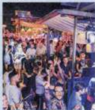
Villa Vittoria - Aperti-Sunday