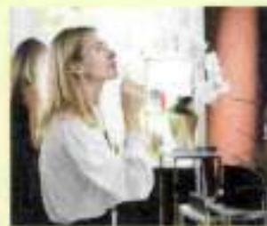
Fragranze alla Stazione Leopolda - ore 10-18

FIERE, SAGRE, MERCATI E MERCATINI DEL WEEKEND da pag. 42 a pag. 62