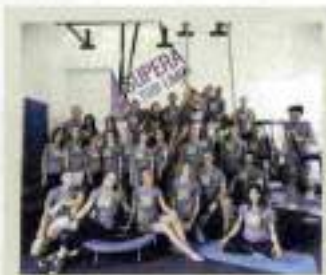
Olympus - grande festa con aperitivo, musica dal vivo e dj set - dalle ore 18

Orchestra da Camera a S. Stefano al Ponte - G. Lanzetta, Direttore - G. Andaloro, pianoforte Avamposti TeatroFestival/Anfiteatro Villa Strozzi - Nessuno il maestro di Firenze con e regia E. Nociolini Villa Vittoria - Fantasy Monday Grand Hotel Principe di Piemonte Viareggio - aperitivo a bordo piscina con musica dal vivo - ore 20-23,30