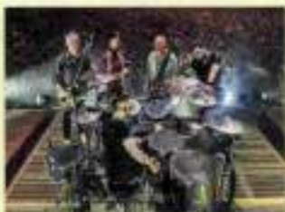
SETTEMBRE PRATO - Subonica

Orchestra da Camera a S. Stefano al Ponte - Quartetto Fiesole - A. Vismara, Direttore e violino solista Estate a San Salvi - Diritto Campagna. Un poeta camminerà Teatro delle Sebe Empireo Plaza Lucchesi Hotel - Filippo Cirri dj set Villa Vittoria - Flamingo Monday Grand Hotel Principe di Piemonte Viareggio - aperitivo a bordo piscina con musica dal vivo - ore 20-22.30