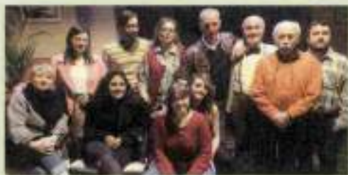
Teatro Castello - Speriamo che sia domenica regia M. Predieri - ore 20.45

Ort all'Abbazia di San Miniato al Monte - B. Venezzi, Direttore d'orchestra