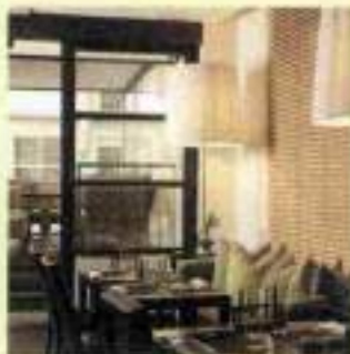
The Fusion Bar & Restaurant - ApivinoFusion aperitivo con dj-set - dalle 18

SETTEMBRE IN PIAZZA DELLA PASSERA - Laisella in "Storie Brevi" - ore 21.30 O Fies Colende a Santa Maria del Fies - Tölzer Knabenchor - C. Flügner, Direttore - C. Hausum, organo Estate a San Salvi - Marie Stuard Comp. del Teatro Tor Bella Monaca Empireo Plaza Lucchesi Hotel - Miro Roppolo DJ Vintage Hard Rock Cafe - Don't stop me now - Be our Freddie for a Night - ore 22 Food Factory - Pink Party - cocktail, musica, cibo - ore 20-01 Grand Hotel Minerva - musica dal vivo sul roof e cocktail bar - dalle 19.30 Irene Biatri/Hotel Savoy - Aperitivo Fish & Spritz - ore 18.30-20.30 Villa Viterbi - Libe a Quasi Metarock/Parco Cittadella Pisa - Rikoni Summer Knight/Piazza dei Cavalieri Pisa - Bardabardo Esce nel Cinema For Lux di B. Corbet