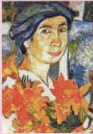
PALAZZO STROZZI - INAUGURAZIONE NATALIA GONCHAROVA tra Casagrande, Melisse, Picasso - fino al 12 gennaio

Oet all'Abbazia di San Miniato al Monte - B. Venezzi, Direttore d'orchestra Teatro Castello - Speriamo che sia femminile regia M. Predieri - ore 20.45 Immagini & Suoni del Mondo a La Compagnia - Festival del Film Etnomusicale - fino a dom 29 Festival Intercity Oslo II/Limonata Sesto - L. Castagnoli regia D. Milopulos Tenax - 20 years Anniversary Nobody's Perfect - ore 21 Teatro del Sale - Diana Winter Festival Carlo Matto - ore 15.30 da Piazza Duomo Santa Elisabetta/Hotel Brunelleschi - Il Sabato enogastronomico: Menu degustazione di carne con vini della Fattoria Selvagiana Villa Vittoria - Pop Star Sexy Discs Excelsior - Jennifer Stone Contemporanea Festival Prato - Metastasio ore 12 presentazione la Funzione Culturale del Festival - Cassero ore 18 C. Calderara Sulla distanza - Manifatture Digitali Cinema ore 19 L. Lacoste Ashbeor - encyclopedie de la parole - Spazio K ore 20.30 L. Casare Toto - Fabbrichino ore 21+21.30 Comp. TPO Pathos a seguire Bathos - Fabbricene ore 22 A. Scianone Augusto