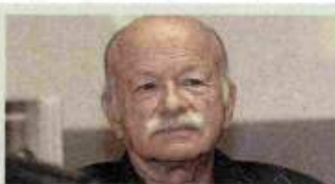
Sommer Knight/Piazza dei Cavalieri Pisa - Gino Paoli

SETTEMBRE IN PIAZZA DELLA PASSERA - Rhythm in Paradise - ore 21.30 Firenze Jazz - Piazza del Carmine e altri luoghi - fino a dom 15 Estate a San Sabini - Maria Stuarda Comp. del Teatro Tor Bella Monaca Empireo Plaza Lucchesi Hotel - Check2Check Picnic - aperitivo Dandy's Night - ore 19-21 Relais La Jardin/Hotel Regency - Torignol Champagne aperitivo con Champagne e delizie del mare in collab. con A. Bergère Villa Cora - Pizza di Champagne a bordo piscina con musica live - ore 20-22 Festa del cinema di Mare a Castiglione della Pescaia - fino a dom 15