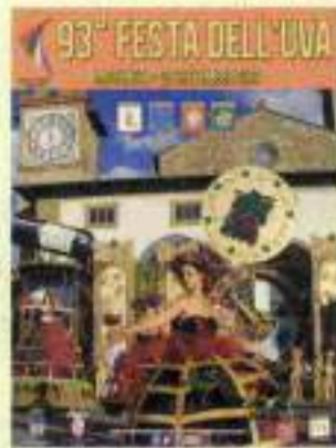
FESTA DELL'UVA A IMPRUNETA - dalle ore 15.30