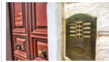
Tabelle millesimali: se un condomino abita in due appartamenti uniti