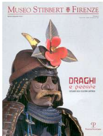
Museo Stibbert Firenze n. 1. Draghi...