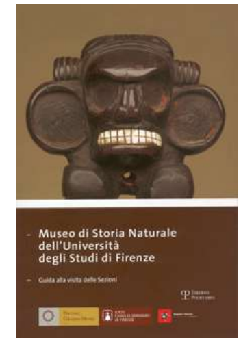
Museo di Storia Naturale dell'Università...