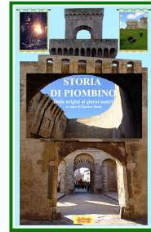
Storia di Piombino