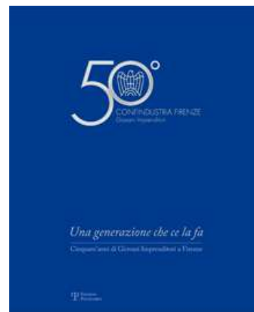
Una generazione che ce la fa. Cinquant'anni...