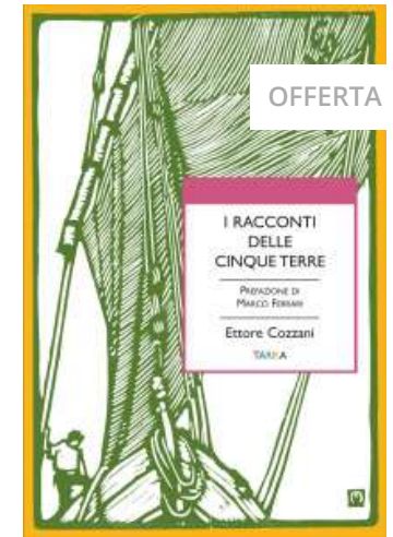
I racconti delle Cinque terre