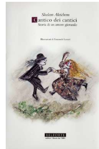
Cantico dei Cantici. Storia di...