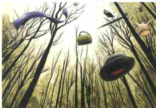
▲ L'illustrazione Un'opera di Gabriella Giandelli in mostra a Treviso

Gabriella Giandelli non illustra, racconta con le immagini: alle sue opere (molte realizzate per Repubblica ) è dedicata la mostra principale del festival. Oggi aprono anche le mostre dell'americana Jen Wang, che incontrerà il pubblico, della tedesca Nadine Redlich, con i suoi disegni giocosi e della francese Cécile Dorveau che esplora il femminile. Tra gli ospiti, il disegnatore statunitense Jason Howard. trevisocomicbookfestival.it